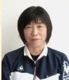
アゼリアヘルパー

月日が経つのは早いもので、入社してから10年以上になりました。この10年の間には、公私ともに様々なことが有りましたが、一番は、子供たちが無事成人を迎えて独り立ちし、肩の荷を下ろすことが出来たことでしょう。その後の趣味としては、友人とのバス旅行に目覚め、観光地巡りや旬の果物狩り、団体だからこそ入れる所など訪れました。まだまだ行きたい所は有ります。新型 コロナが終息した際には、活動再開したいと思っています。