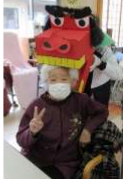
1月獅子舞 今年は 良い年に なりそう♡