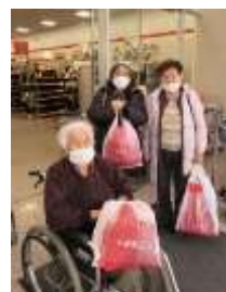
12月しまむらへ買い物・クリスマス会 たくさんの笑顔が見られました