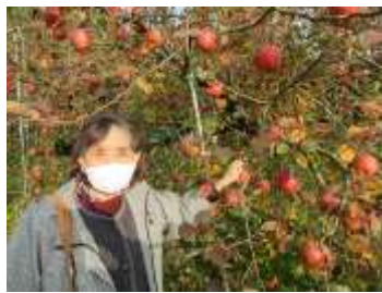
11月りんご狩り 真っ赤に実ったリンゴは 甘くて美味しかったです