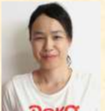
グループホームあかり

訪問介護員として入社し16年が経過しました。入職時、幼稚園生だった子供達も、長男は4月に社会人となり、次男は1月に成人式を迎えるまでになりました。この間、幾度となく『この仕事は、私には向いていないのではないかと』、考えることもありましたが、同僚や友人、母、夫の協力もあって、ここまで続けることが出来ました。これからも初心を忘れず、新型コロナが猛威を振るう状況の中で、感染対策に注意を払い、ご利用者さんや同僚とのコミュニケーションを大切に『あなたに会えるのを待っていたのよ』と、言って頂けるよう、誠心誠意、日々努めて参りますので、今後とも宜しくお願い致します。