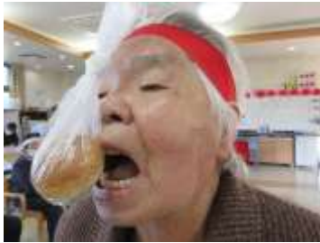
10月運動会 パン食い競争は白熱 しました