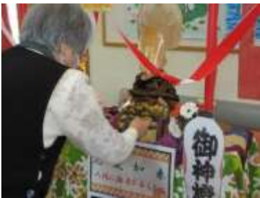
1月新年会 今年も元気神社が登場！！ 願い事はきっと叶うはず！