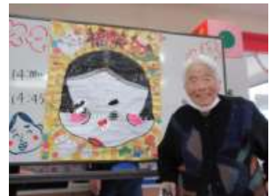
1月福笑い どちらの顔も笑顔満点！