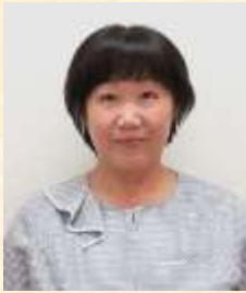
支援センターアゼリア