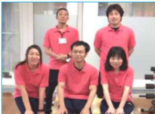
訪問リハビリのスタッフ

自宅内を歩くのに不安がある方や、病気になり料理や洗濯が上手く行えない方、食事中にむせ込む方、言葉がはっきりせず会話に困っている方等、日常生活内で困っていることに対し専門のリハビリスタッフがご自宅に訪問し、利用者様の希望に沿ったリハビリテーションを提供いたします。また、利用者様への関わりだけではなくご家族様への助言、生活環境の調整、福祉用具の選定や紹介、地域・社会参加への促しも行ってまいります。