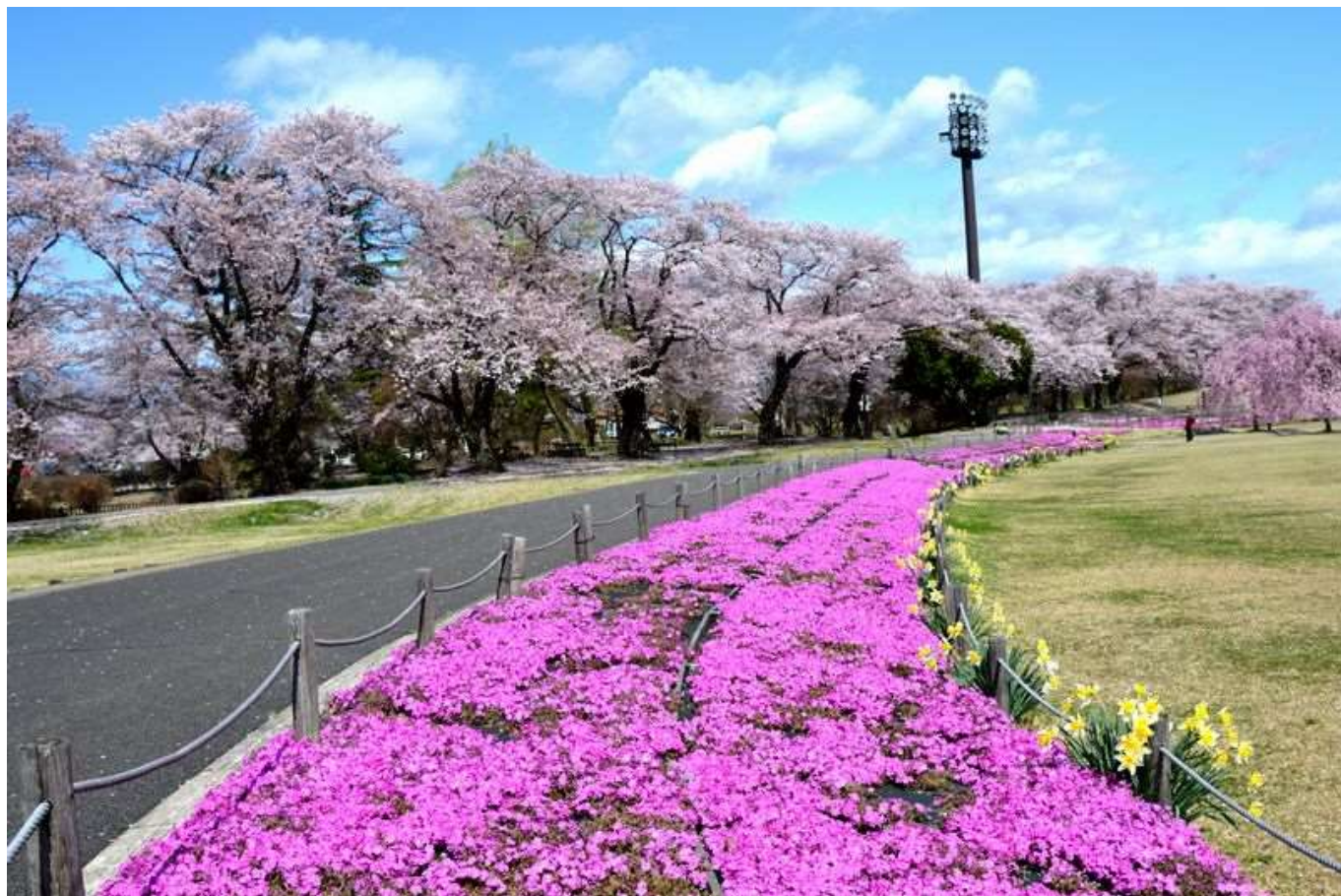
長峰公園