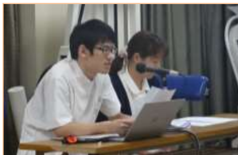
発表者の様子。透視センターでは透視患者さんにより良い透視療法を提供するための発表がありました。

為王会では、良質の医療サービスが行える職員の育成を目指し、今後も事例を通して学び、感謝し合える組織作りを目指していきます。