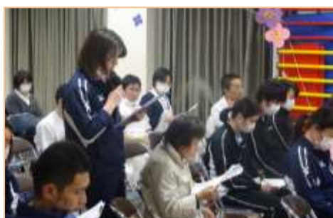
参加者の様子。どの発表に関しても熱心な質疑応答がありました。